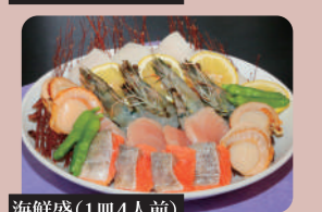
牛肉(1皿4人前) 海鮮盛(1皿4人前) 豚肉・ラム肉・鴨肉もご用意しております。