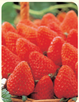
小人(3歳～未就学児) 330円引